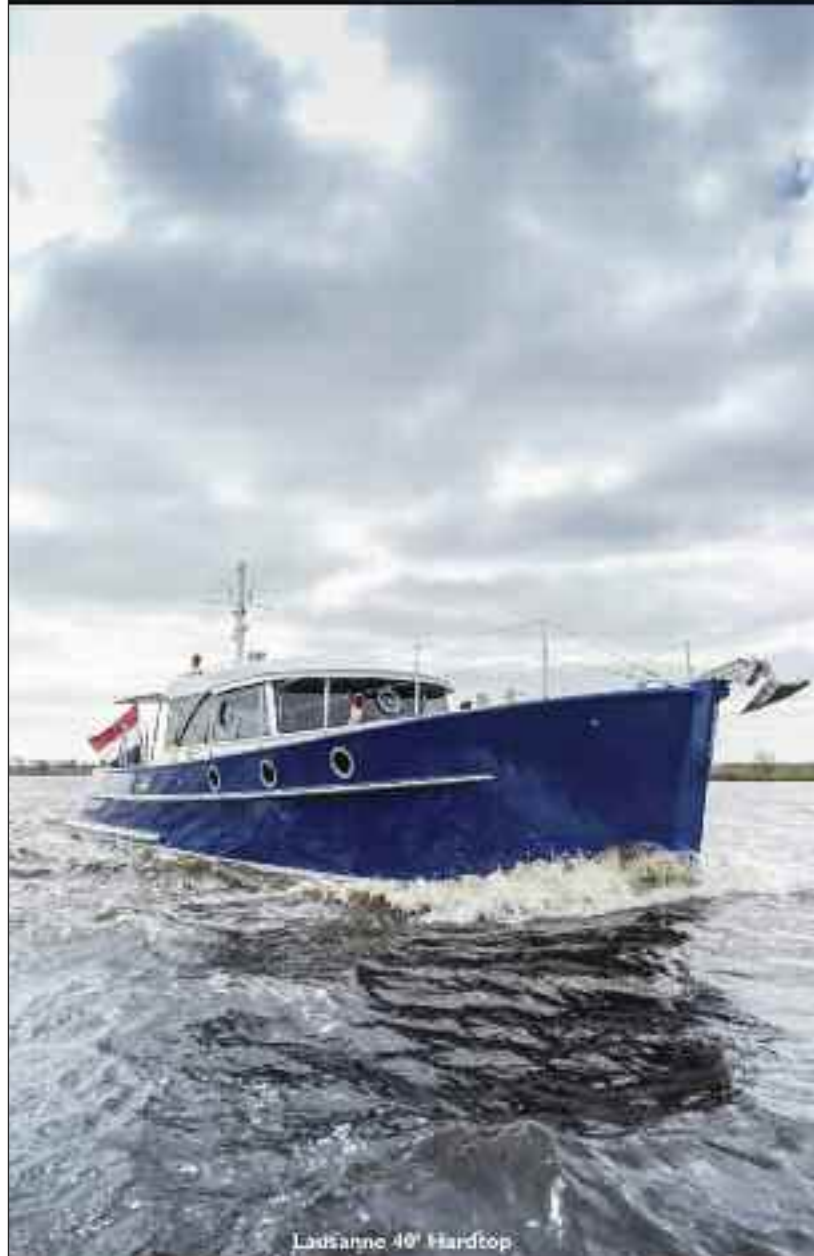
Lausanne 40' Hardtop

exklusive holländische Seachtjachten von 36' bis 66', custom built only